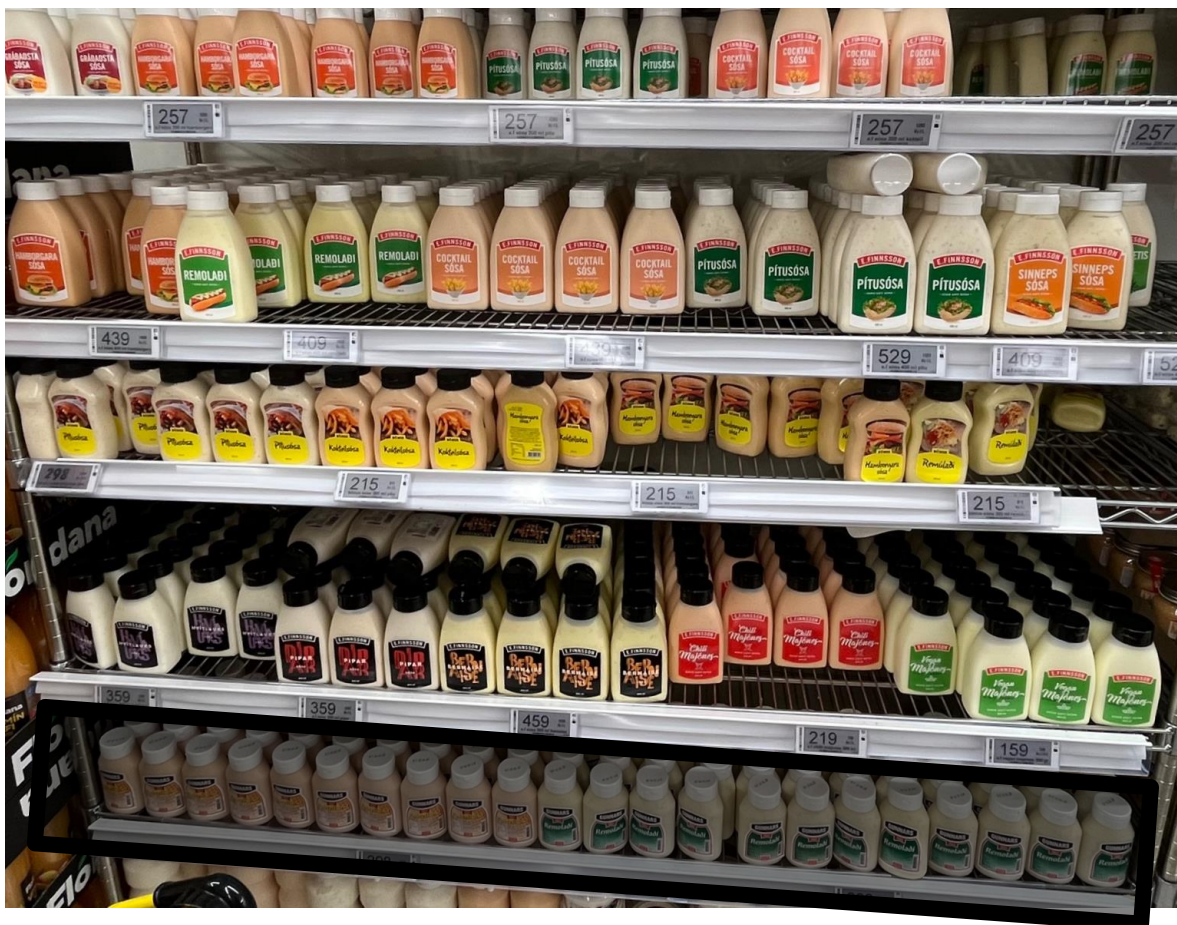
Mynd 7. Dæmigerð framstilling í Krónu-verslun (Festi)