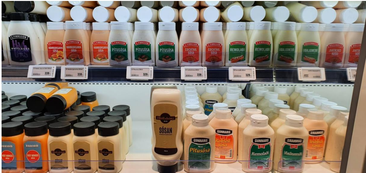
Mynd 6. Dæmigerð framstilling í Bónus-verslun (Hagar)